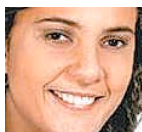
Andreia Zito Deputada federal pelo PSDB

Recentemente, parabenei o presidente da Câmara dos Deputados, Marco Maia, por ter declarado, em entrevista, que “não pode haver pauta proibida no Congresso” e que “não está escrito em nenhum lugar que o Legislativo tem de fazer só o que o Executivo quer”.